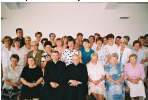
Ze spotkania Koordynatorów 17.06.2007